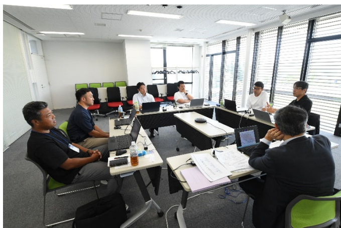
東北大学会場での対面実習の様子

東北大学と北海道大学が主催する、新事業創出のための実践型プログラムです。 地域経済の担い手である中小企業の皆様が持つ革新的なアイデアや構想を、実行可能な新事業計画として具体化する力を養います。 卒塾生(2025年度までの累計424名)同士の交流も活発に行われており、人的ネットワークづくりの有力な機会にもなります。 本セミナーでの学びをさらに深め、「自社・地域の次の一手」を形にする場としてぜひご活用ください。