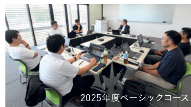
2025年度ベーシックコース